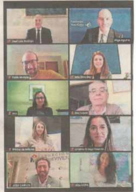
Firma 'online' de la convocatoria de Funda

Las ayudas de Fundación Ibercaja y Fundación CAI en Aragón se dirigen a apoyar aquellos proyectos que tienen como objetivo la inserción laboral e integración social de colectivos en situación o en riesgo de exclusión o dependencia social; igualmente contemplan inicia-